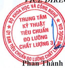
Phan Thành Trung

1. Các kết quả thử nghiệm ghi trong phiếu này chỉ có giá trị đối với mẫu do khách hàng gửi đến và không phải là giấy chứng nhận sản phẩm.